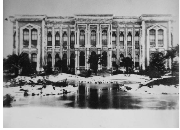
Heybeliada-Bahriye Mektebi ve Kasımpaşa-Deniz Harp Mektebi Çekirdekliği

Kasımpaşa'daki ortam ve binalar Bahriye Mektebi'nin eğitim-öğretim uygulamaları için yetersiz görüldüğünden Harp Okulu 12 Ekim 1930 tarihinde Heybeliada'ya dönmüştür. Bu tarihten sonra Harp Okulu ve Deniz Lisesi aynı yönetim altında birleştirilerek "Deniz Harp Okulu ve Lisesi Müdürlüğü" adı ile faaliyetlerine devam etmişlerdir.