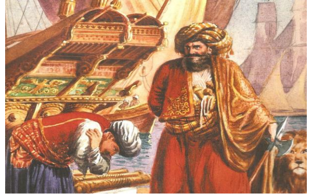
Tersane Hendesehanesi ve Cezayirli Gazi Hasan Paşa

Bir süre sonra tersanedeki hendesehanenin dar olması ve ihtiyacı karşılayamaması üzerine, Tersane Emini Mehmet Ataullah Efendi tarafından Tersane Zindanı yanındaki üç ambarlı kalyonların yapıldığı Kasımpaşa-Camialtı mahali civarında birkaç odalı bir bina inşa edilmiş, okul bu yeni binaya 22 Ekim 1784 tarihinde taşınarak faaliyetlerine " Mühendishane-i Bahri Hümayun " adıyla devam etmiştir. Okul, 1795'te III. Selim'in fermanı ile kurulan " Mühendishane-i Sultani "ye bağlanmıştır.