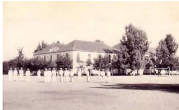
Heybeliada-Bahriye Mektebi ve Kasımpaşa-Deniz Harp Mektebi Çekirdekliği