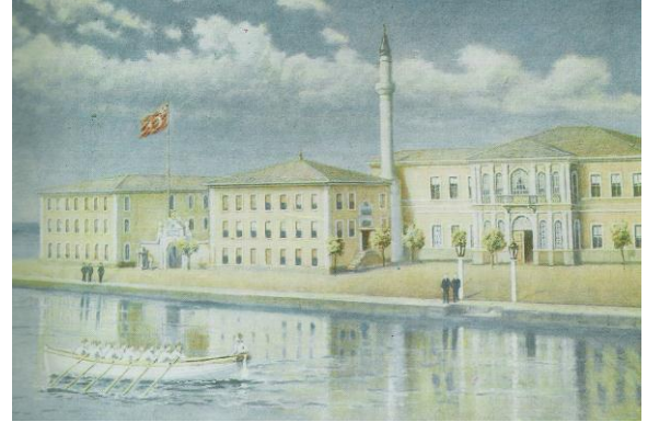
Kalyoncu Kışlası – Heybeliada

Mekteb-i Bahriye'ye alınan öğrencilerin eğitim yönünden yetersiz olması nedeniyle Mekteb-i Bahriye'nin idadi kısmının kurulmasına karar verilmiş ve 29 Ekim 1852'de Mekteb-i İdadiye-i Şahane (Deniz Lisesi) adıyla kurulan okulun 4 yıl süreli idadi kısmı açılmıştır.