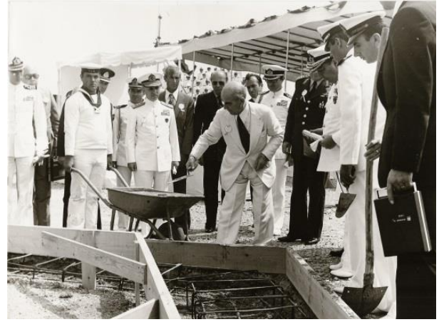
Deniz Harp Okulu Tuzla Kampüsü Temel Atma Töreni (28 Temmuz 1977)

Tuzla'daki modern Deniz Harp Okulu tesisleri, 31 TEMMUZ 1985 tarihinde Cumhurbaşkanı Kenan EVREN tarafından hizmete açılmış ve Heybeliada'daki tesisler Deniz Lisesi Komutanlığı'na devredilmiştir.